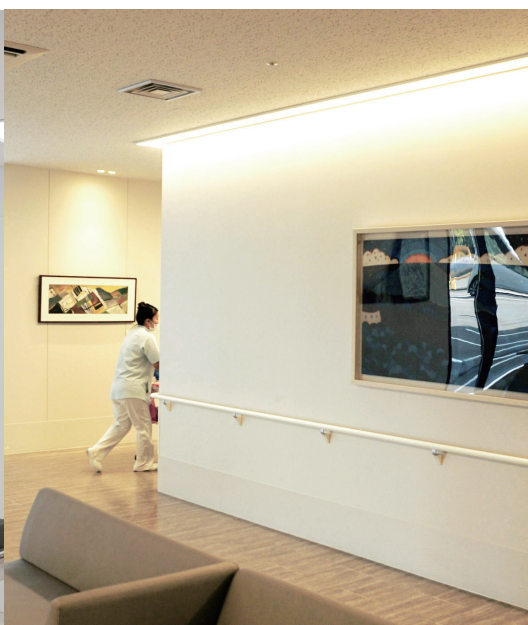
Flat base light